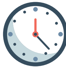
Prüfung aller Rechnungen