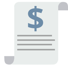
Die Rechnung wird erstellt und versendet